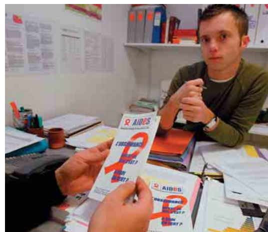
>> On estime que 100 millions de personnes seront porteurs du virus VIH dans le monde d'ici 2010.